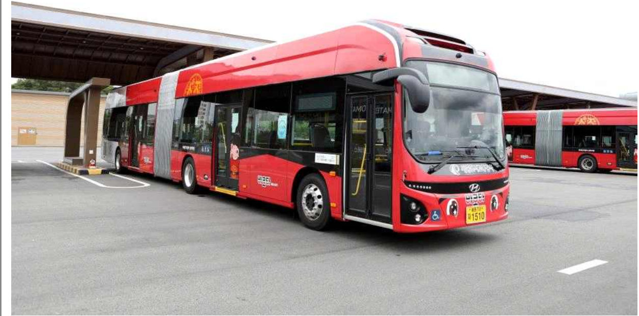
전기굴절버스와 '젊은 세종 충녕' 캐릭터