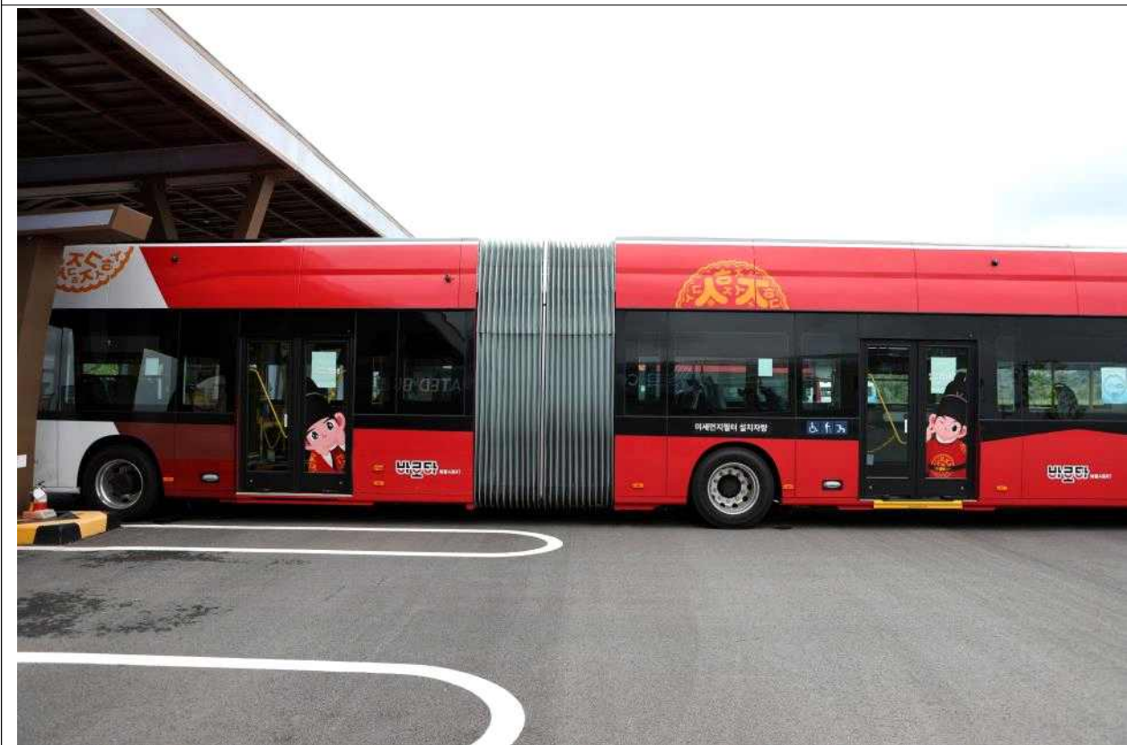
전기굴절버스 인도면 '젊은 세종 충녕' 캐릭터