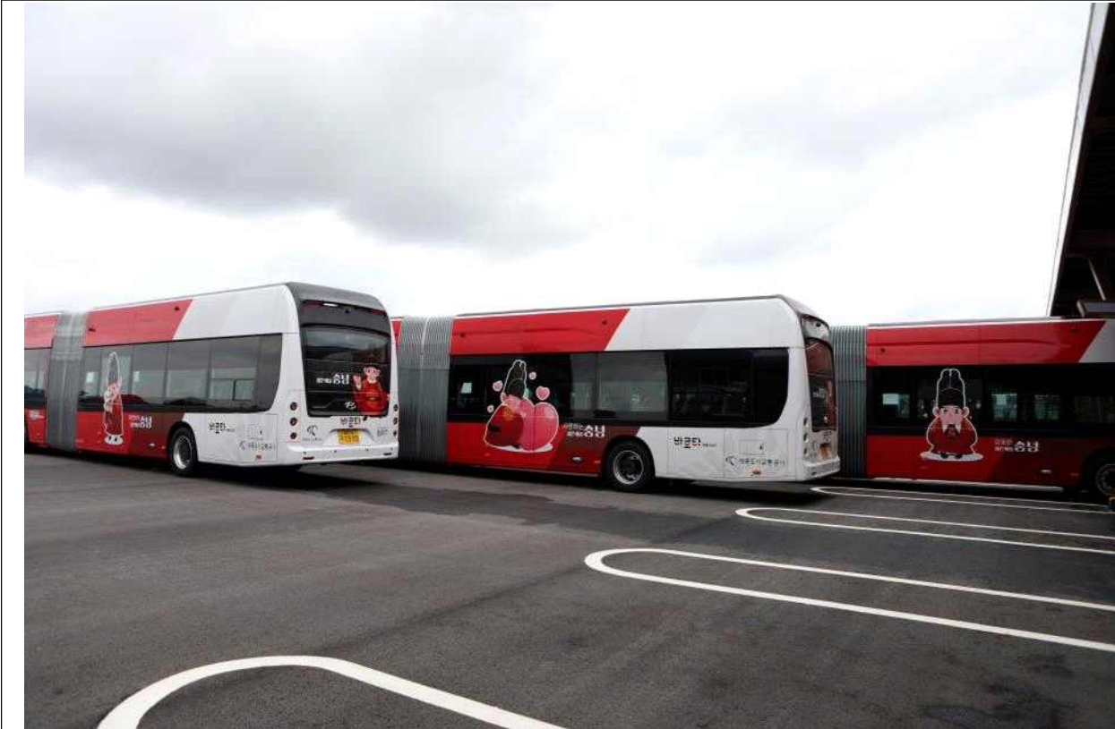
전기굴절버스 차도면 '젊은 세종 충녕' 캐릭터 2