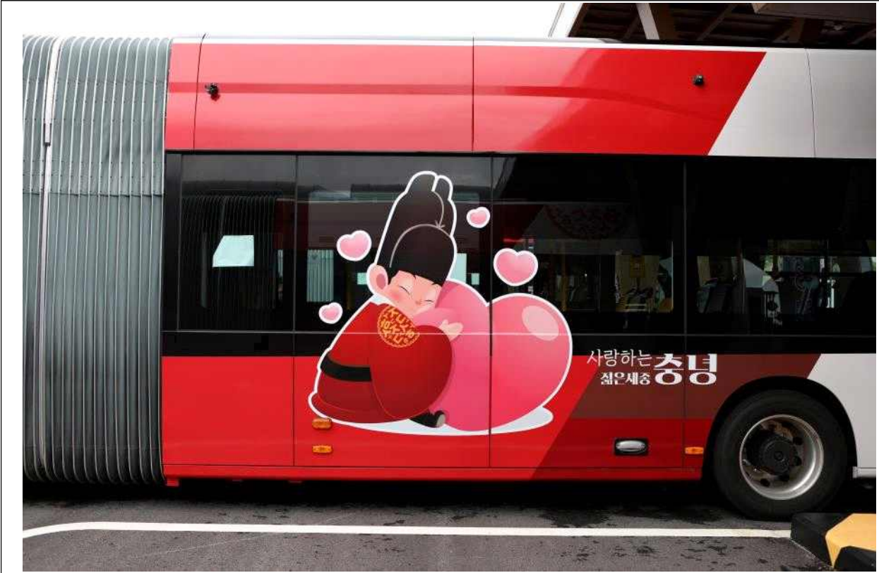
전기굴절버스 차도면 '젊은 세종 충녕' 캐릭터 1